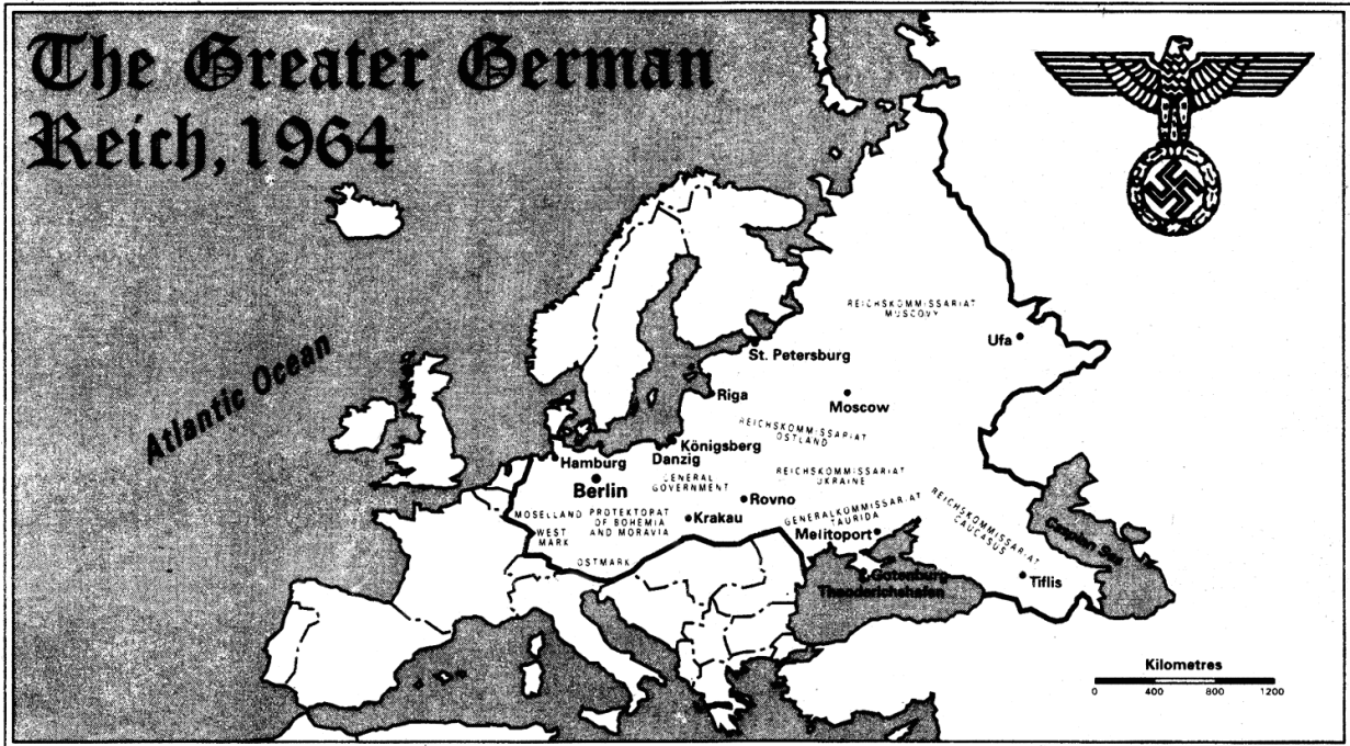
Великият германски райх, 1964