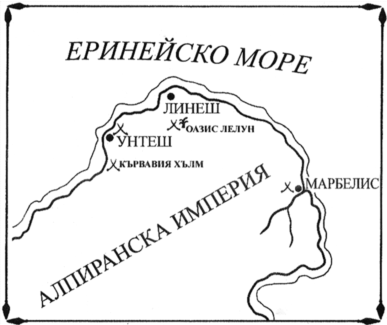
Северното крайбрежие на Алпиранската империя