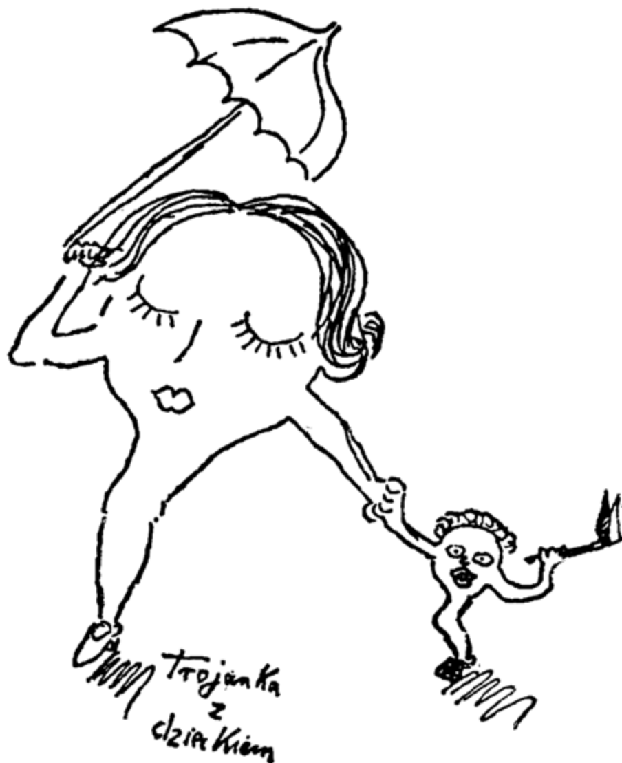
Троячка с детенце

все пак човек трябва да се въздържа да ги къса, понеже ужасявката живее в тясна симбиоза с каменосмазвачката — дърво, което ражда плодове с размерите на тиква, само че рогати. Достатъчно е да се откъсне едно цветенце и върху главата на невнимателния колекционер на растителни екземпляри се срутва град от твърди като скала полета. След това нито ужасявката, нито каменосмазвачката правят нещо лошо на умъртвения, понеже се задоволяват с естествените последици от неговата смърт — тя съдейства за наторяване на почвата около тях.