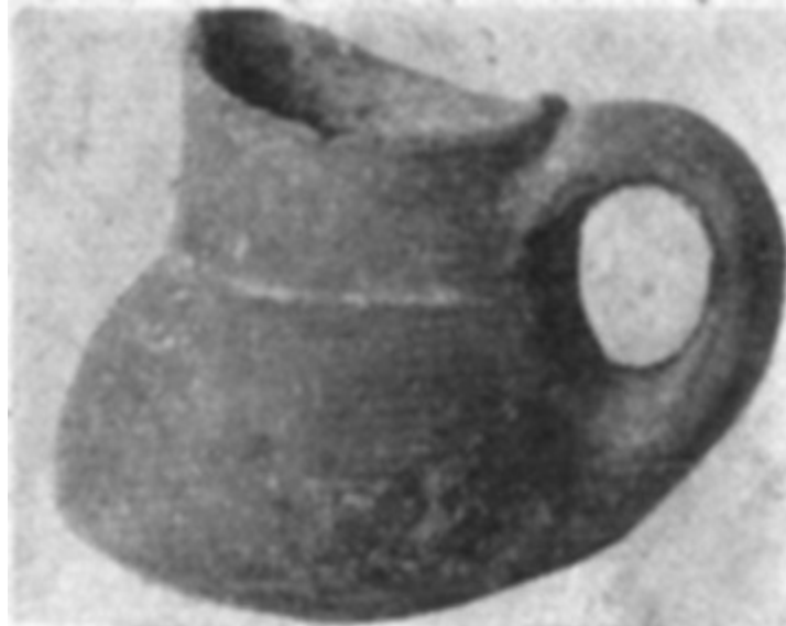
Фиг.2. Глинена чаша — бронзовата епоха