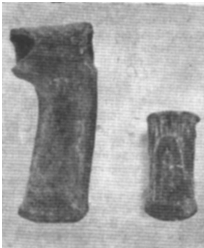
Фиг.1. Бронзови брадви от м. Бреста

Непосредствено на югозапад от селището на първобитните хора в м. Бреста, по време на Бронзовата епоха (1,900–800 г. пр.н.е.) съществувало голямо тракийско селище. При изкопите, тук се намериха богати културни останки: основи на землянки, огнища, хромелни мелници, две бронзови брадви (фиг.1), глинени съдове (фиг.2), тежести за вертикален тъкачен стан и прешлени за вретена.