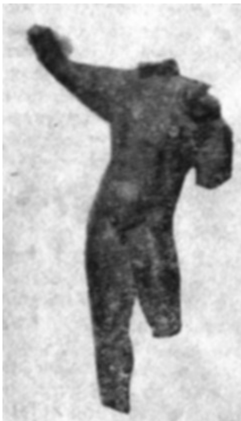
Фиг.6. Бронзова статуйка на Хермес

С падането на България под турско робство (1393 година) селото Алтимир остава на същото си място. Тук е съществувало то и през годините на робството и е било разрушено от кърджалиите в края на XVIII век.