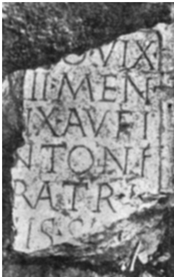
Фиг.5. Отломък от плоча с латински надпис

След разрушаване на римското селище и крепост, дълги години околностите на Алтимир са представлявали обезлюдена пустош. Как е било латинското име на крепостта Калето и селището в м. Хоросаня, за сега остава неизвестно. С изчезване на старото тракийско и римско население, изчезнало и името на крепостта и селището. Можем обаче да се надяваме, че в околностите на Алтимир има още латински надписи, в някои от които в близко бъдеще бихме научили античното име на римската крепост и селище. Едва през VIII век тук било образувано малко славянско селище. Неговите останки се намират и сега по левия бряг на Скът — западно от днешните гробища, в местността наречена Цолов Кривол или Селището. Преди тридесет години тук бяха разкрити основите на няколко постройки и камъкът от тях изваден. Местното население наричаше тези постройки „Мазите“.