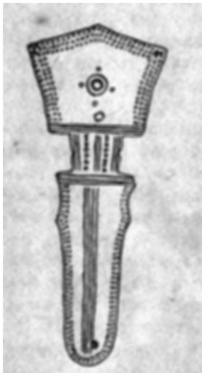
Сребърна римска фибула от м. Калето

За да утвърди господството си на Балканите (I-V в.н.е.) Римската империя построява стотици крепости и укрепени селища, настанява в тях войски, прокарва пътища. Такъв един римски път е вървял от Улпия Ескус (при дн. с. Гиген) нагоре срещу течението на р. Искър за Сердика (дн. София). Под селото Долни Луковит от него се е отклонявал друг път в югозападна посока, минавал е край днешните селища Кнежа, Алтимир, Сираково и е стигал Монтана (дн. Михайловград) от дето е продължавал за Ниш и пр.