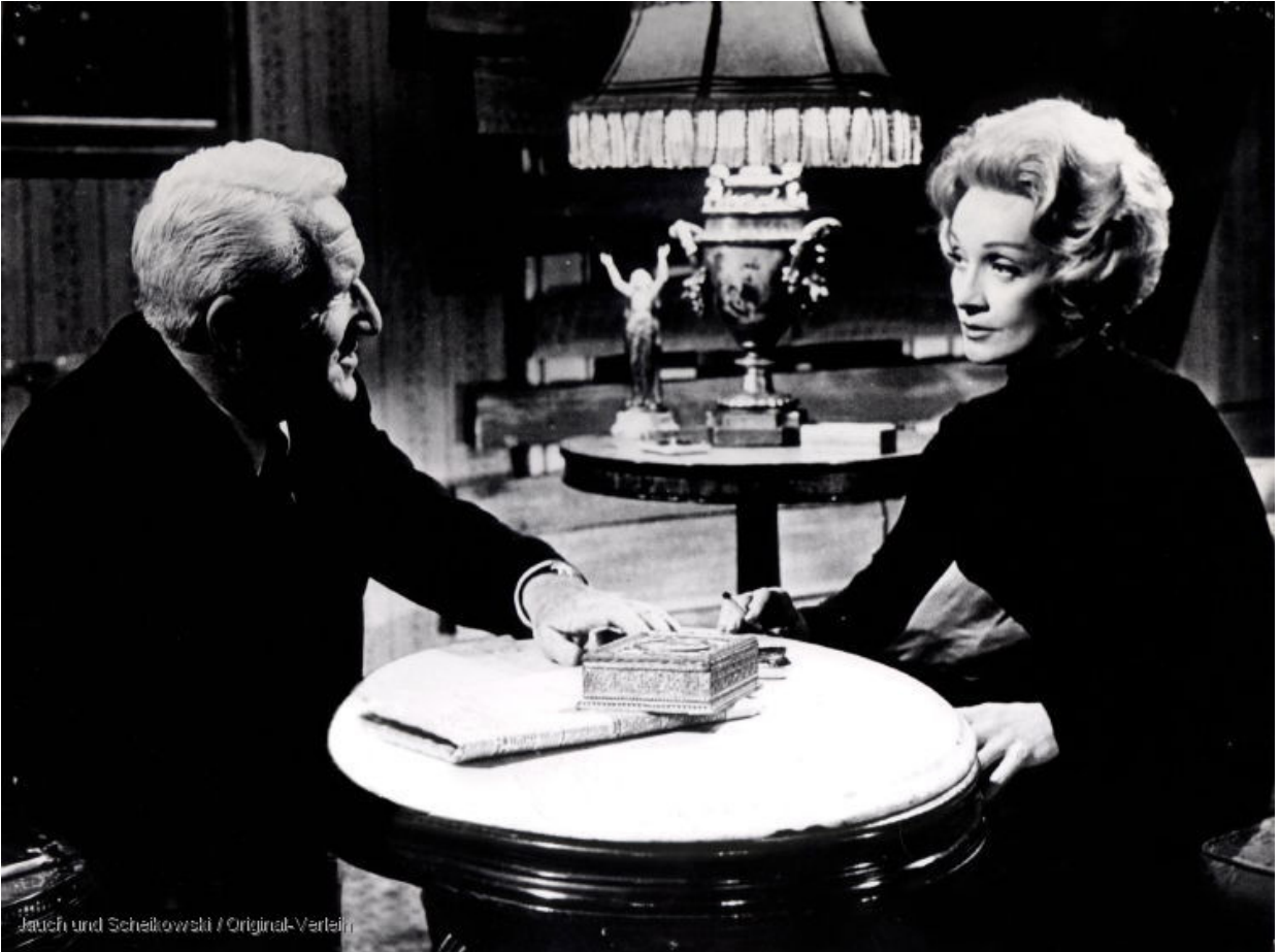
Със Спенсър Трейси в „Нюрнбергският процес“