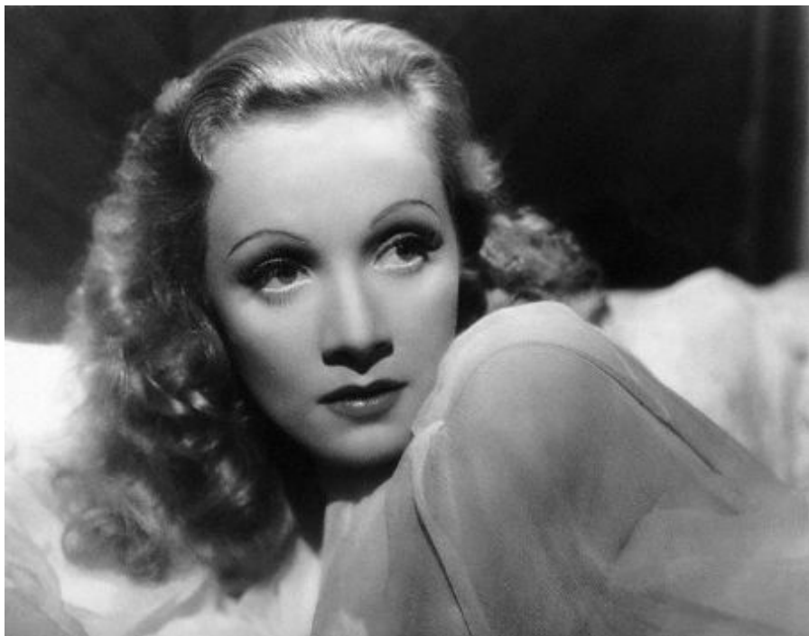
Идеал за красота в Холивуд през 30-те години