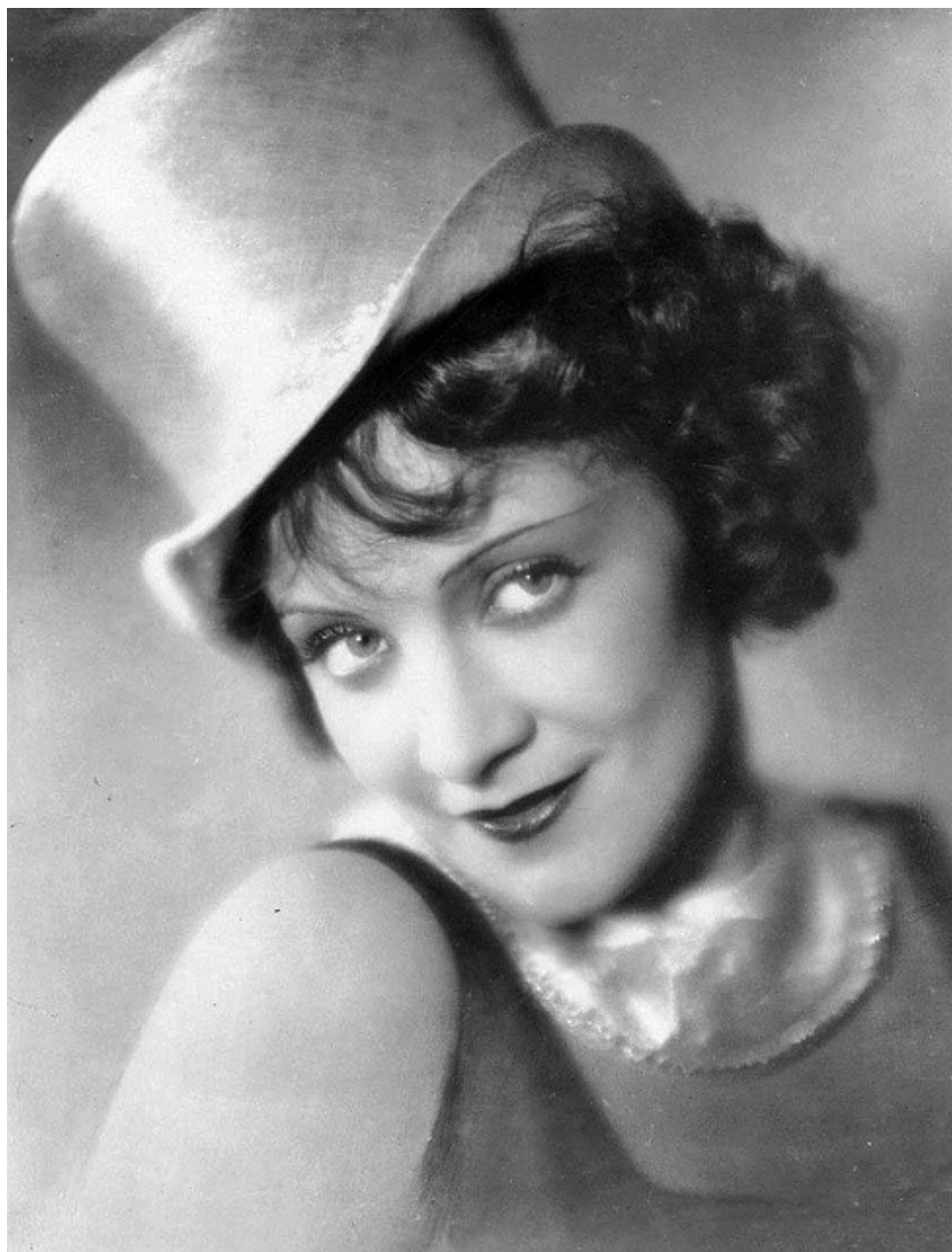
Във филма „Синият ангел“