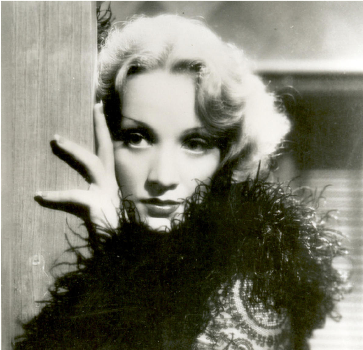
Във филма „Шанхайски експрес“