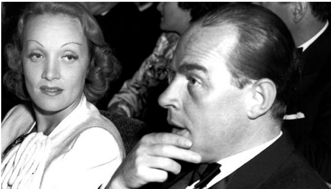
С Ерих Мария Ремарк