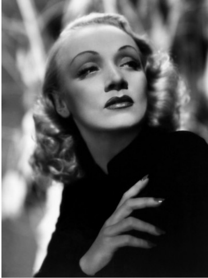
Лицето от рекламния плакат