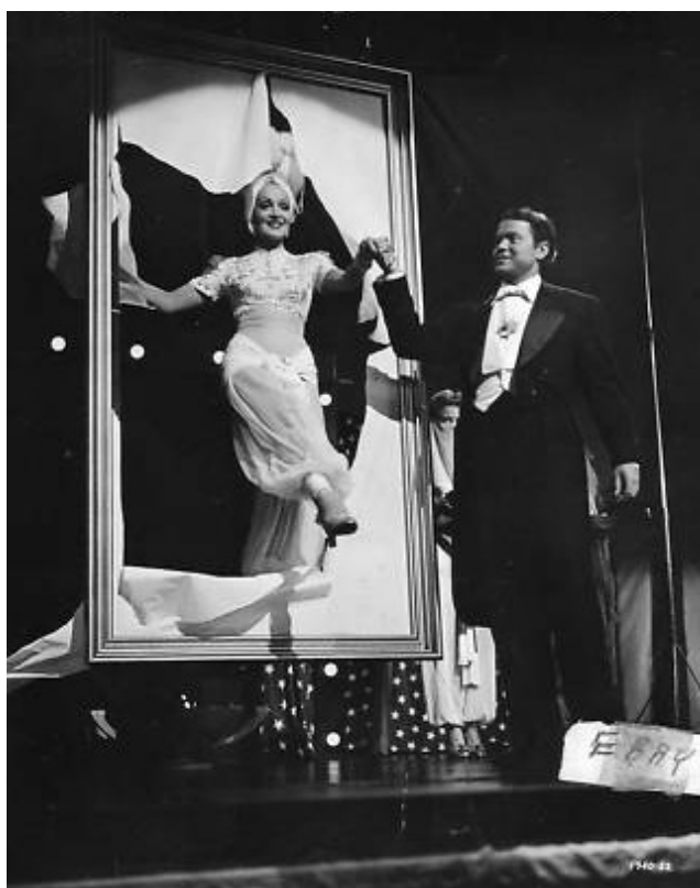
С Орсън Уелс