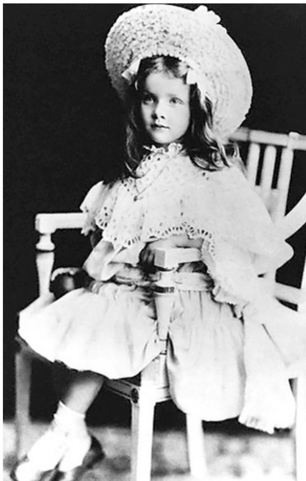
Снимка от 1906 г.