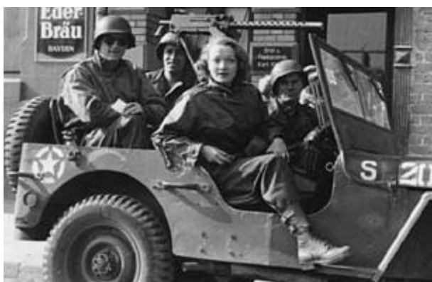
На фронта през 1944 година