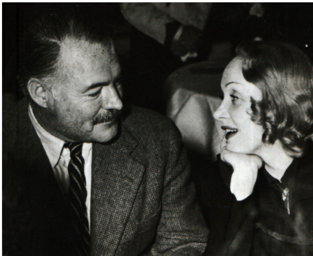
С Ърнест Хемингуей