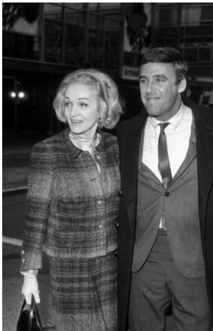
С Бърт Бакарак