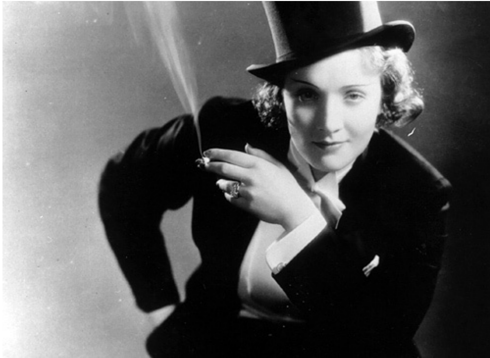
Прочутият „портрет във фрак“ от филма „Мароко“