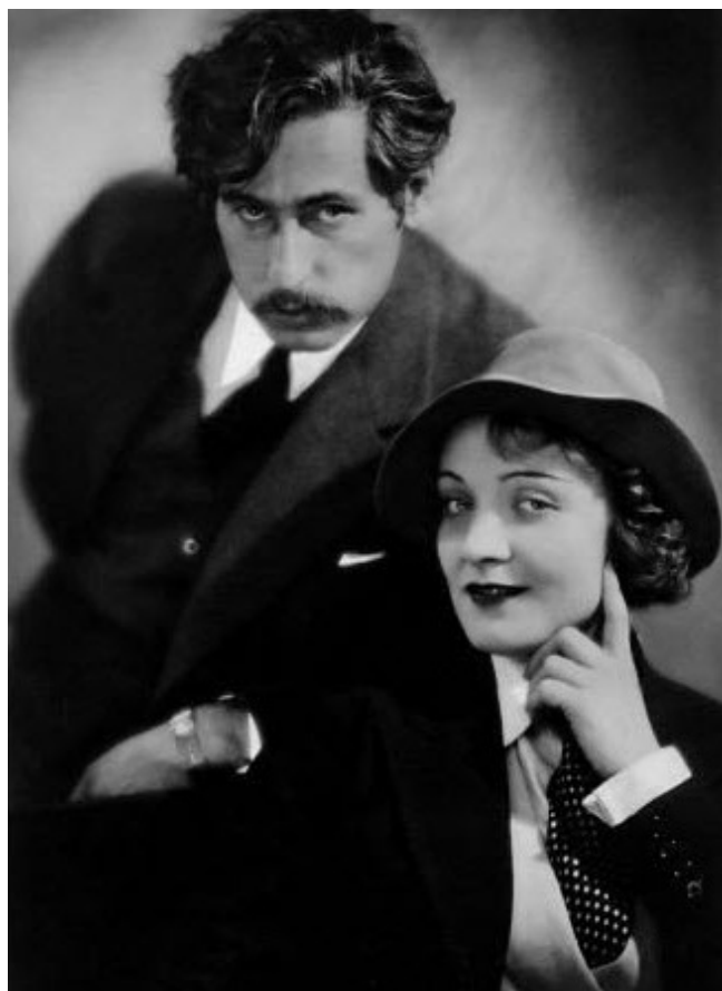
С Джоузеф фон Щернберг