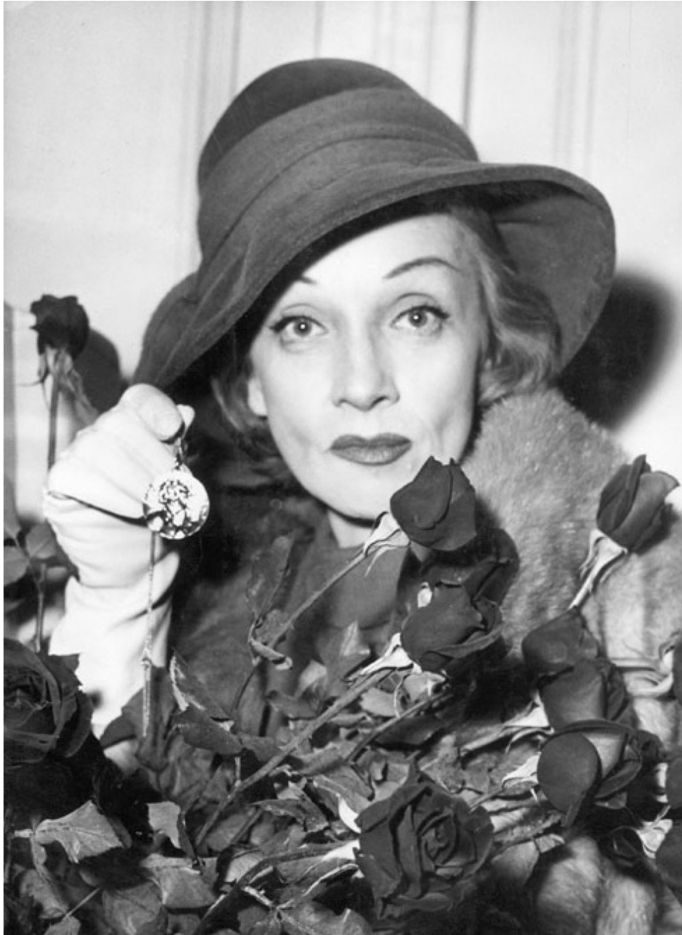
Една неугасваща звезда

Преди да отидем във Франция, бяхме в Африка и Италия. Там играехме за американски и френски части, но нито веднъж не видяхме истинската война, не чухме ужасния ѝ рев.