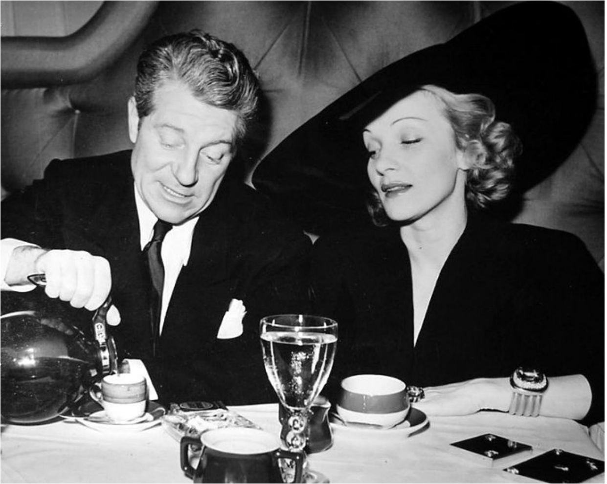
С Жан Габен