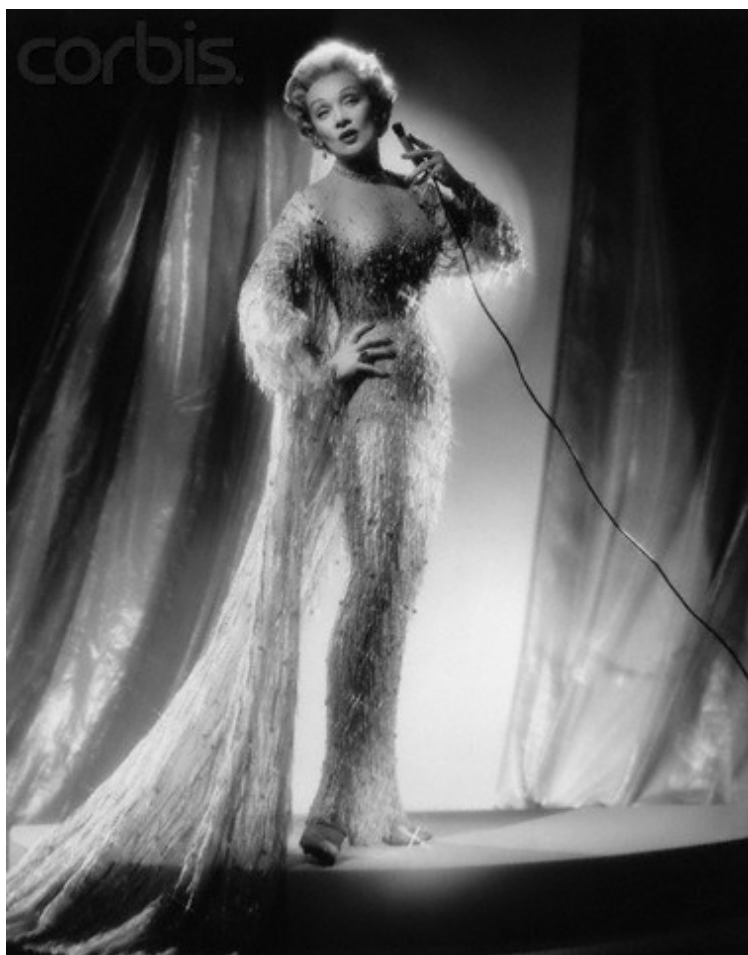
На сцената — 1955 г.