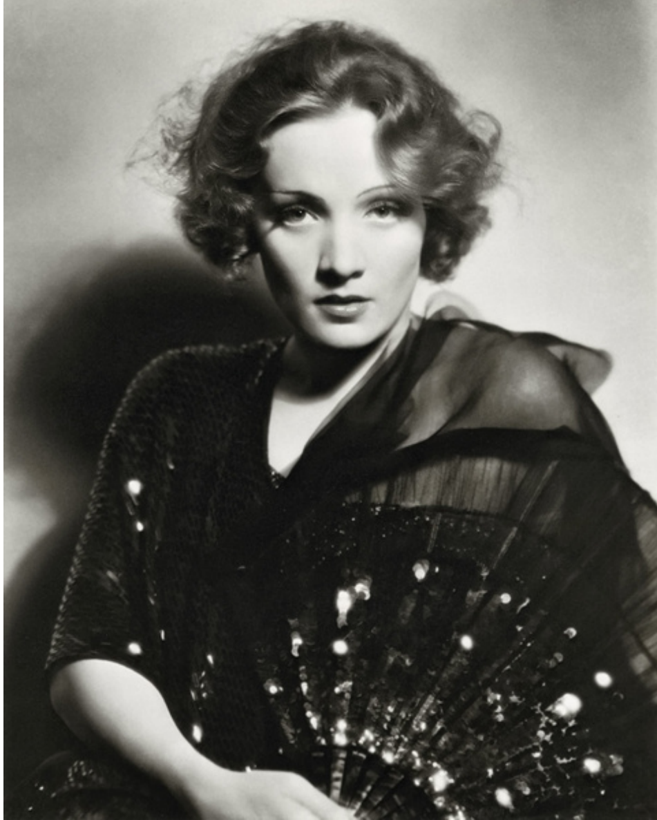
Във филма „Русокосата Венера“