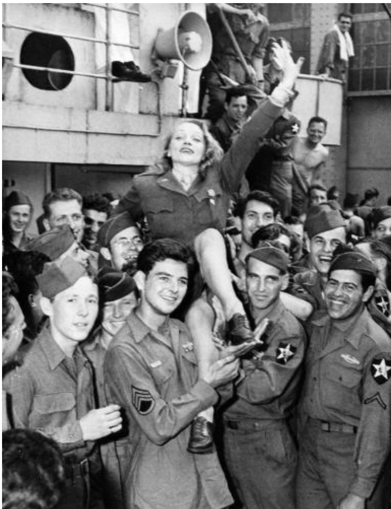
Със съюзническите войски