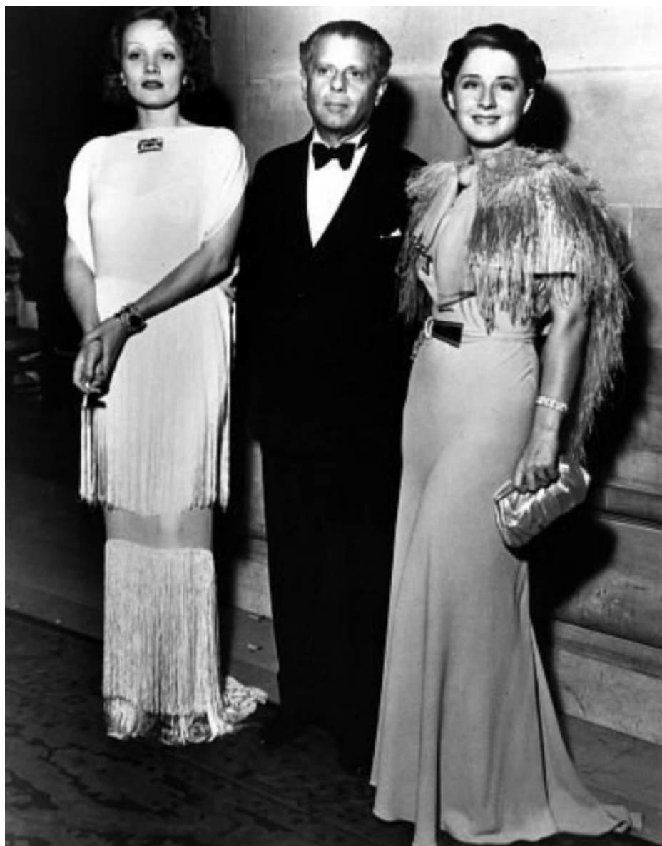
С Норма Шиърър и Макс Райнхард