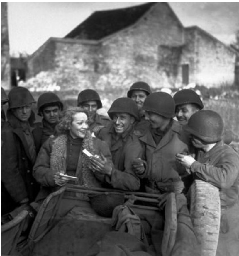
Със съюзническите войски през 1945 година в Германия