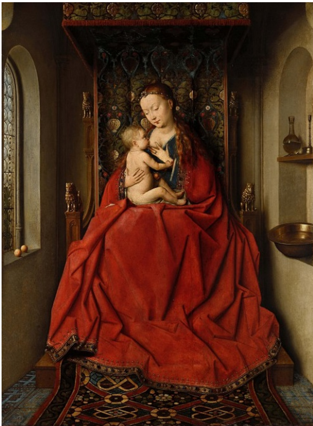
Мадона Лука. Около 1430 г. Дърво, 66 x 50 см. Франкфурт, Институт за изобразителни изкуства „Щедел“.

Облечената в аристократична пурпурна мантия Богородица, която е получила странното си име от предишната собственица на картината, някаква херцогиня на име Лука, е седнала на престол, позата и е тържествена, симетрична. Сиво-зелената стена е прорязана от два подобни един на друг отвора — единият е прозорецът, другият