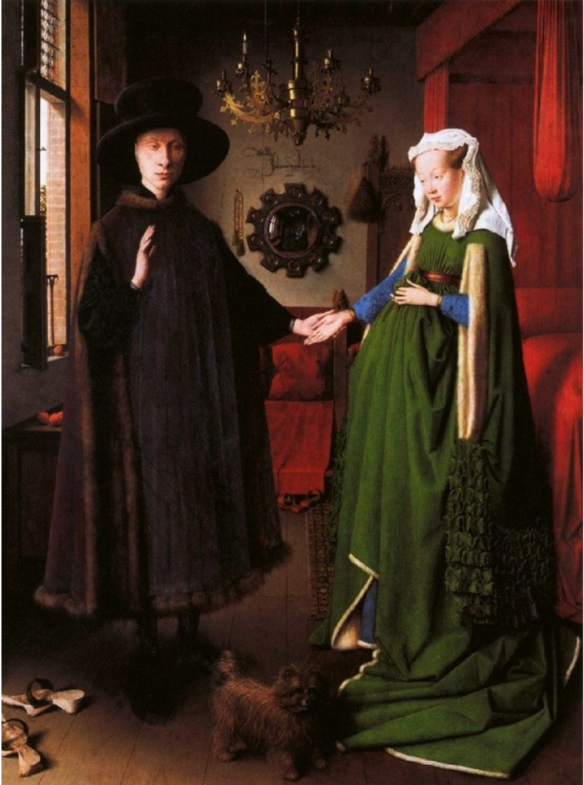
Портрет на семейство Арнолфини. 1434 г. Дърво, 82 x 60 см. Лондон, Национална галерия.