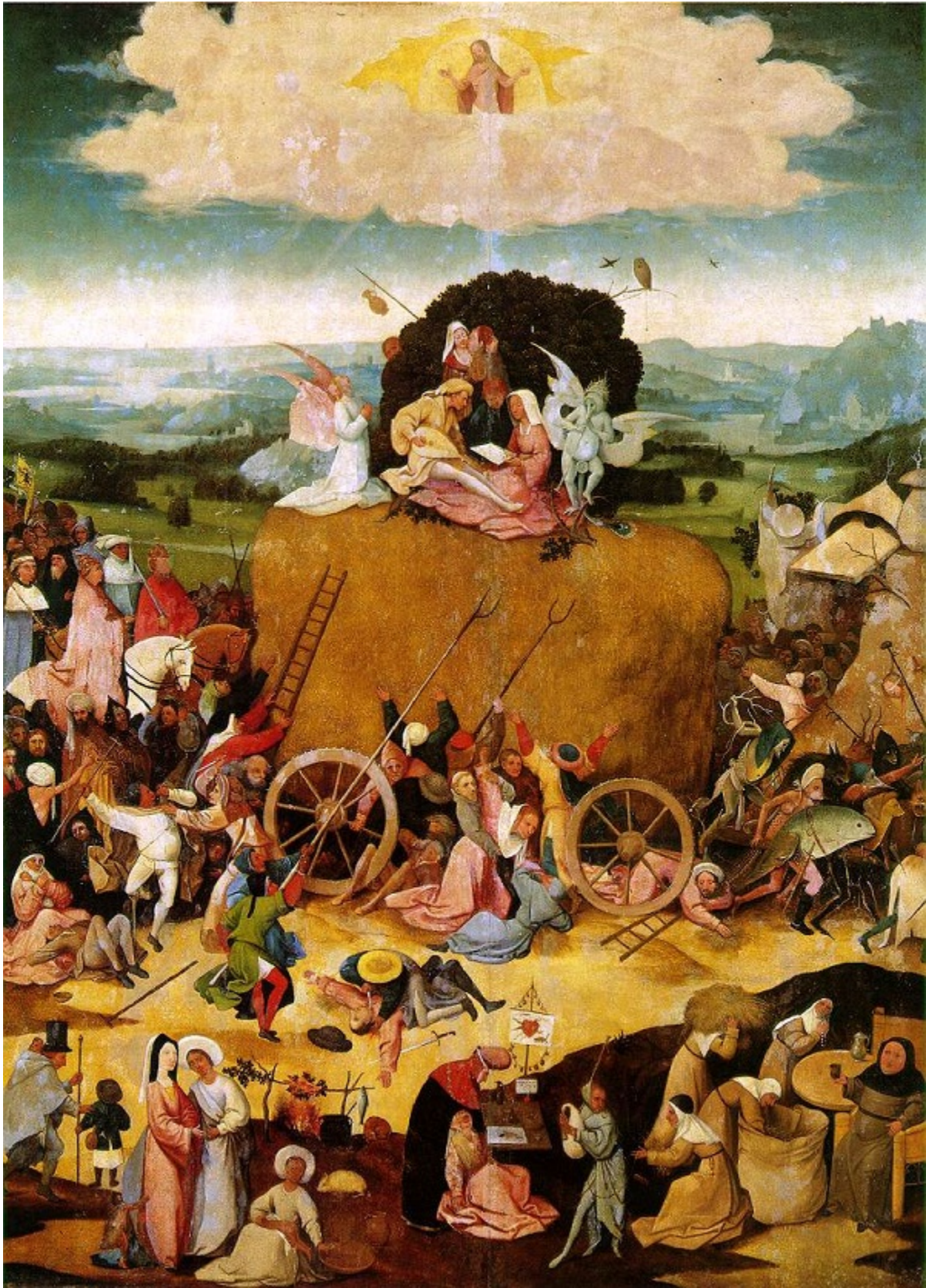
Кола сено. Около 1490 г. Дърво, 135 x 100 см. Мадрид, Прадо.