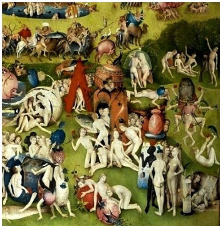
Градината на наслажденията (детайл от изготвено в ателието на майстора копие по картината на Бош). Началото на 16 век. Платно, размери на цялата картина 166 x 158 см. Будапеща, Музей за изящни изкуства.

погледнем как корените му разпукват земята) свидетелствуват за това средновековно схващане. Агнето срещу Йоан е символ на чистотата; несъзнателният жест на пръста показва на чия страна е отшелникът.