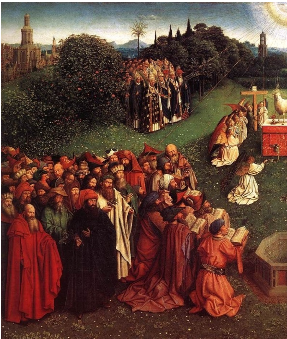
Мистичният Агнец (детайл). Преди 1432 г. Дърво, размери на цялото табло 136,5 x 242 см. Гент, катедралата.

Олтарът на Агнеца се намира в центъра на картината. На поклонение пред него се стичат представители на цялото човечество. В показания тук детайл се виждат коленичилите апостоли, зад тях патриарсите, а сред храстите — групите на мъчениците. Картината е