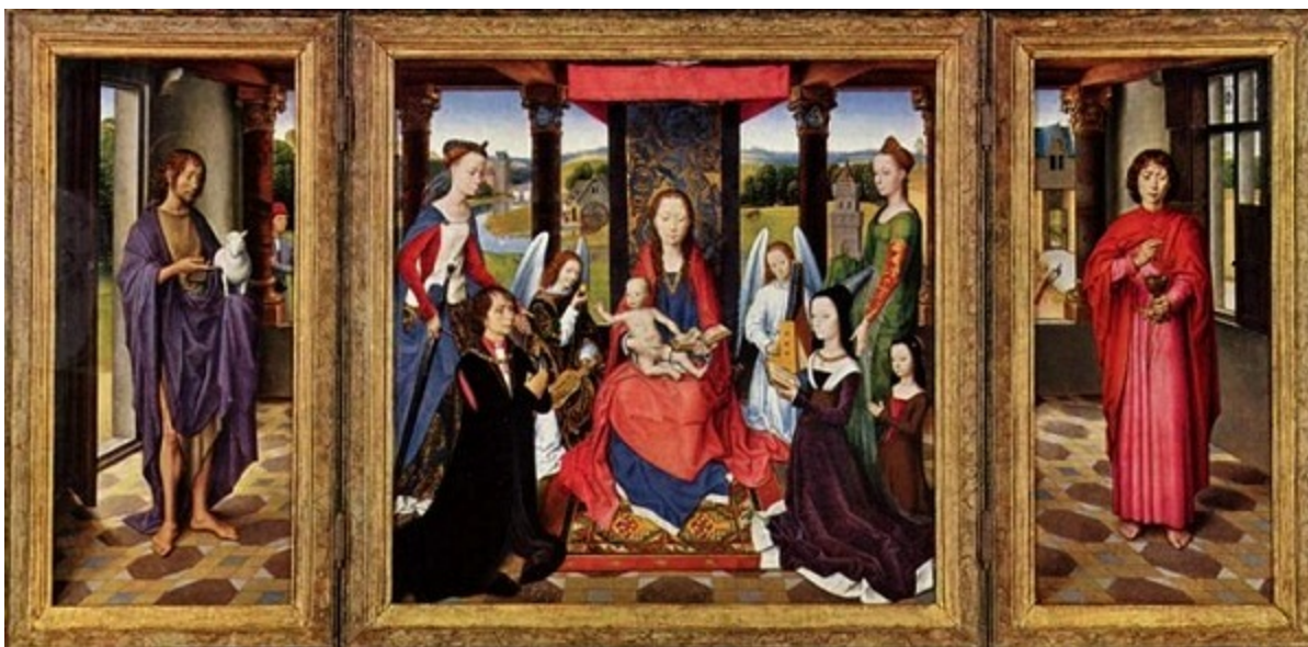
Олтар на Богородица 1468–1470 г. Дърво, 71 x 68 см. Лондон, Национална галерия.

Когато Мемлинг умира, вписват в книгата за покойниците на енорийската църква „Св. Донациан“, че в негово лице се е преселил на оня свят „най-големият живописец на християнския мир“. Тези думи днес в най-добрия случай можем да приемем като проява на местен патриотизъм, тъй като най-големите нидерландски художници, които са на равнището на Ян ван Ейк, заслужават да бъдат споменати преди него. Но въпреки че Мемлинг, за разлика от Ван Ейк и Бош, не е бил новатор, той има свое неоспоримо място в сърцата на многобройните почитатели на изкуството.