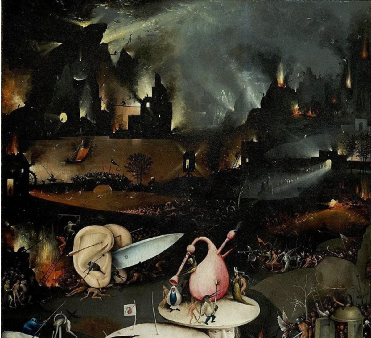
Адът (детайл от дясното крило на триптиха „Градината на наслажденията“) 1495–1500 г. Дърво, размери на цялото табло 220 x 97 см. Мадрид, Прадо.

Цялата земя се е превърнала в ад, всички грешници от средното крило са подложени на наказания. Призрачни пръски светлина, бликащи от фантастични дворци, преминават през целия потънал в мрак свят, където малки зли същества са подкарвали като стада нещастниците към избраните от тях мъчения. Ние не виждаме самите мъчения (с изключение на изобразеното вляво обесване), трудно е да се досетим и каква е функцията на търкалящия се в ухоподобното колело нож, но при все това едва ли ужасите на ада биха могли да бъдат представени по-нагледно и по-осезателно.