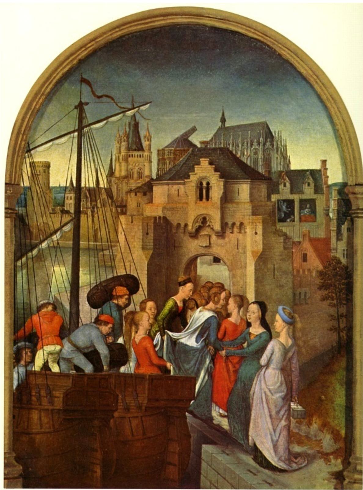
Св. Урсула пристига в Кьолн 1489 г. Дърво, 42 x 25,5 см. Брюге, болница „Св. Йоан“.