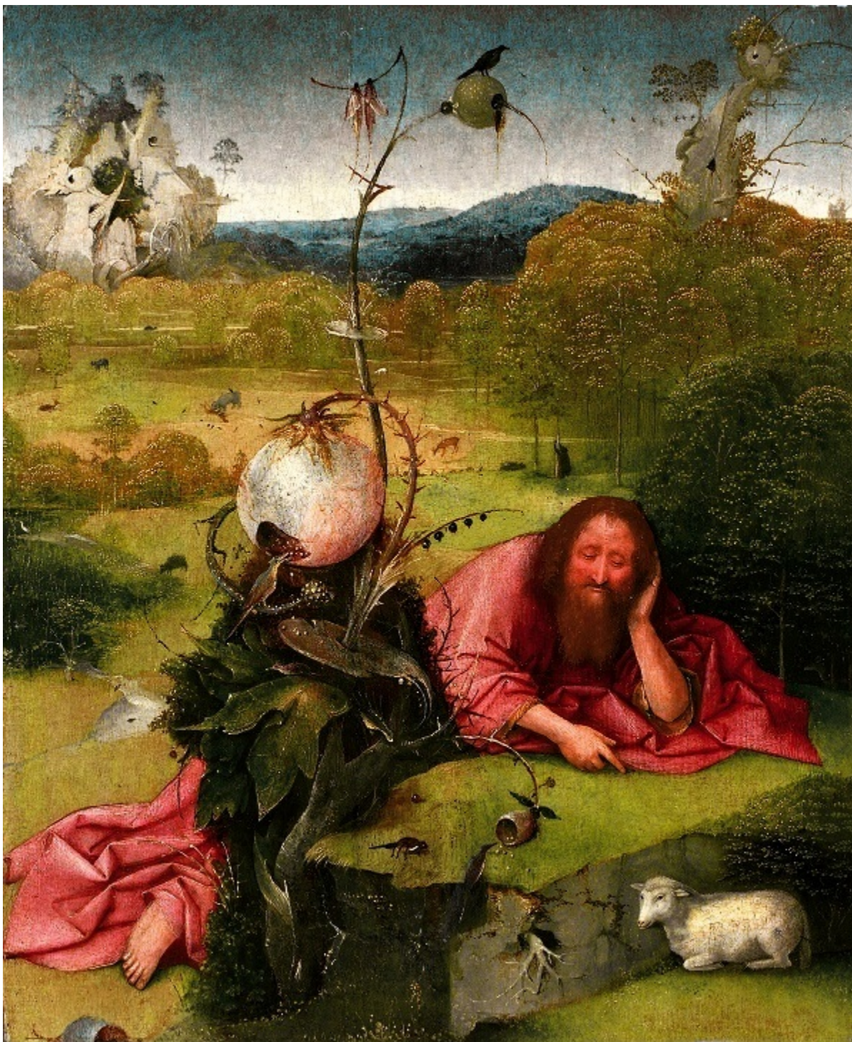
Йоан Кръстител в пустинята. Около 1490 г. Дърво, 48,5 x 40 см. Мадрид, музей „Ласаро Галдиано“.

Светецът, притворил очи, е потънал в размисъл. Избуялото в нозете му растение е символ на плътските наслади. Неговата пищност, необикновените му размери, разрушителната му агресивност (да