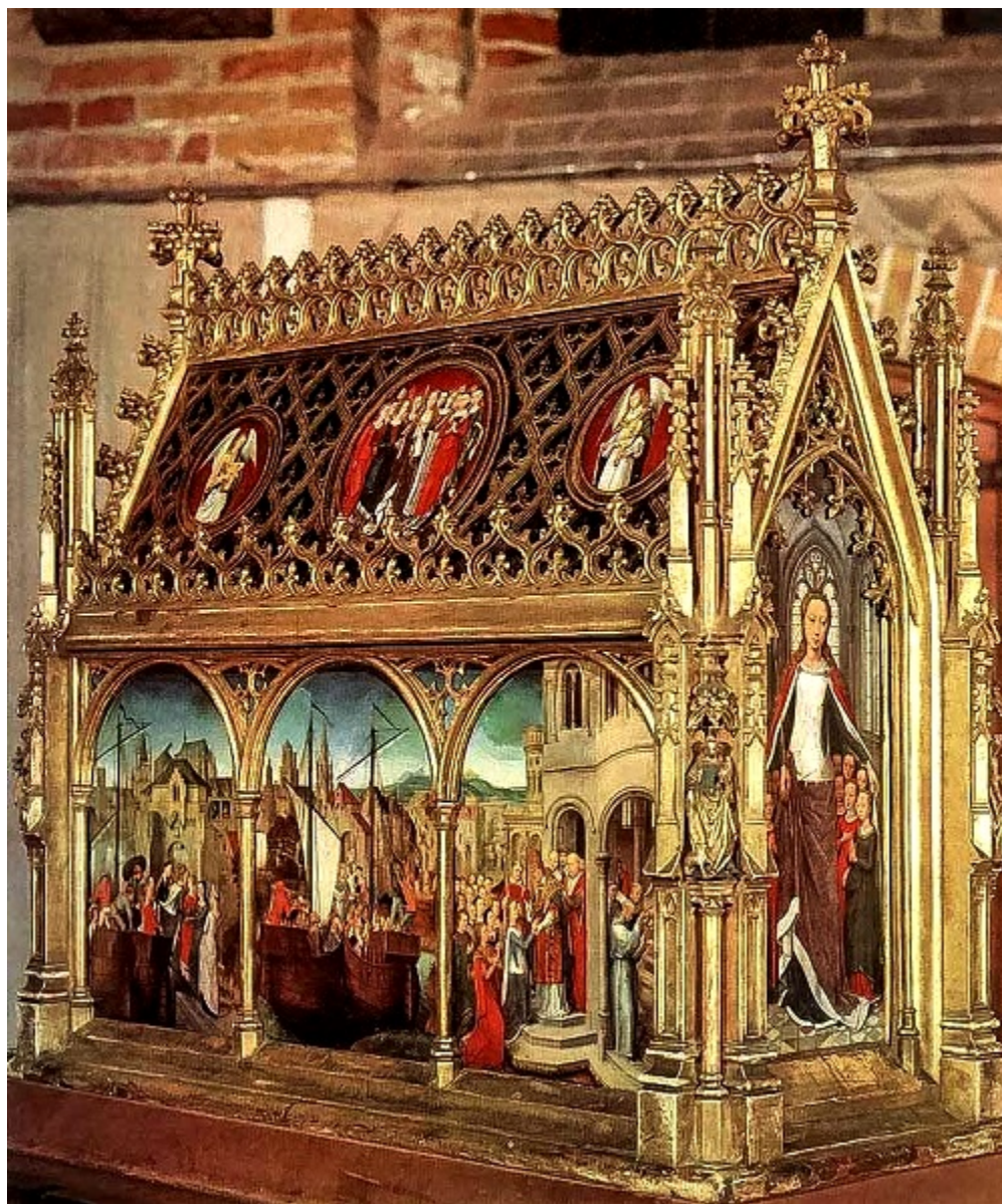
Мощехранителница на св. Урсула. 1489 г. Дърво, височина 86 см. Брюге, болница „Св. Йоан“.

приближава и съответно се отдалечава от центъра, обединява пръснатите сцени.