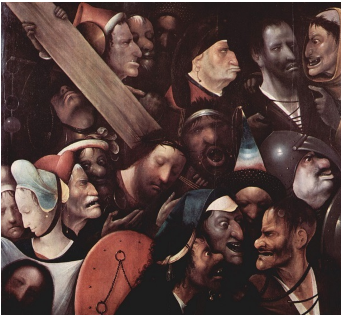
Носене на кръста. 1515–1516 г. Дърво, 76 x 83,5 см. Гент, Музей за изящни изкуства.

Пръстен от зли, безмилостни глави е притиснал като в менгеме призрачното лице на Христос. Добрият разбойник в горния десен ъгъл и Вероника долу вляво просто се губят сред тях. Претрупаността ни позволява да почувствуваме шумната многолюдност на шествието. Мълчанието на човека, който носи кръста, изразява не само безпомощността на осъдения на смърт, но и добротата на Спасителя. Рисуването на такива образи трябва да е било приятен отдих за Бош и те ни дават възможност да го видим в светлина, различна от обичайната.