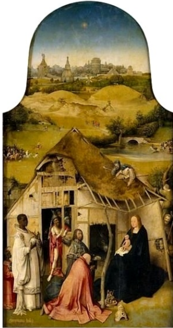
Поклонение на влъхвите. Около 1510 г. Дърво, 138 x 72 см. Мадрид, Прадо.

Пред нас е излъчващ празнично настроение, просторен пейзаж, сред който ясно е изписан витлеемският обор. Тук Богородица със седналия в скута и Исус приема тримата влъхви, които са дошли да се поклонят. Върху малката ивица небе доминира витлеемската звезда, довела влъхвите тук. Няма и следа от по-ранните картини на майстора, гъмжащи от демонични фигури, само облечените в странни дрехи любопитни зяпачи ни напомнят за тях.