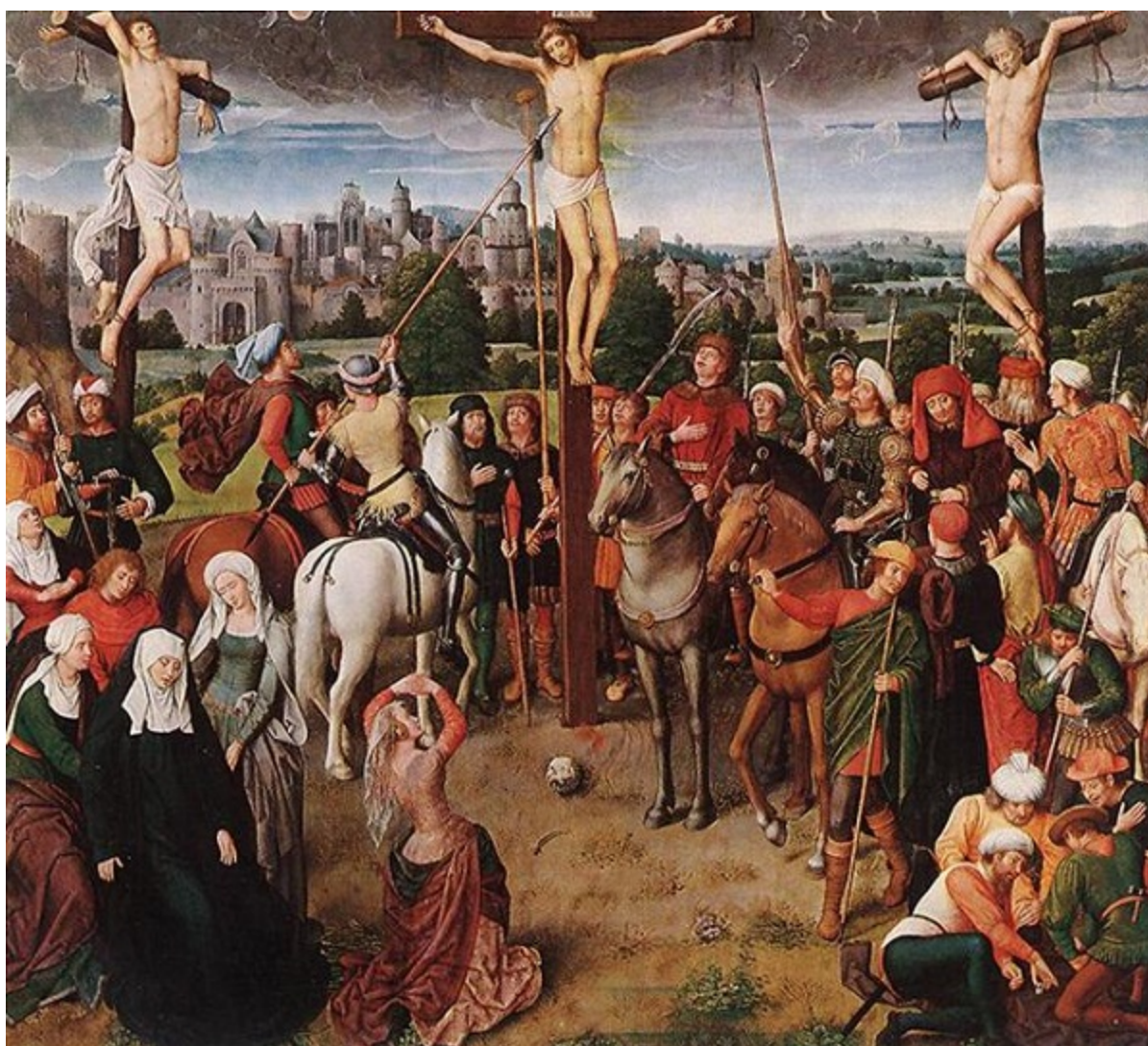
Христос на кръста. Около 1480 г. Дърво, 56 x 63 см. Будапеща, Музей за изящни изкуства.

Майсторът толкова подробно е изобразил рейнския бряг по повод пристигането на светите девойки, щото някои изследователи предполагат, че той е пребивавал години наред в Кьолн; от картината му прекрасно могат да се проучат употребяваните към края на 15 век типове платноходи. Главното ударение обаче пада върху многобройните девойки в пъстри дрехи, които с бавна крачка минават през отворените градски порти. Виждаме владетелката веднъж на преден план в момента, когато стъпва на брега, втори път на заден план, където можем да я зърнем през липсващата стена на една къща; тук ангелът я известява за мъченията, които ѝ предстоят.