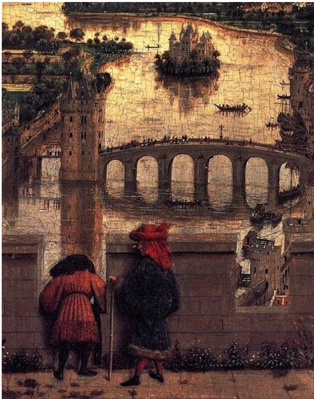
Богородица с канцлера Ролен (детайл).

всичко е молитвеникът, който той разсеяно прелиства. Наистина и Богородица е не по-малко величествена; въпреки че дрехите ѝ са обикновени, блестящата от скъпоценни камъни корона представлява изящно ювелирно произведение.