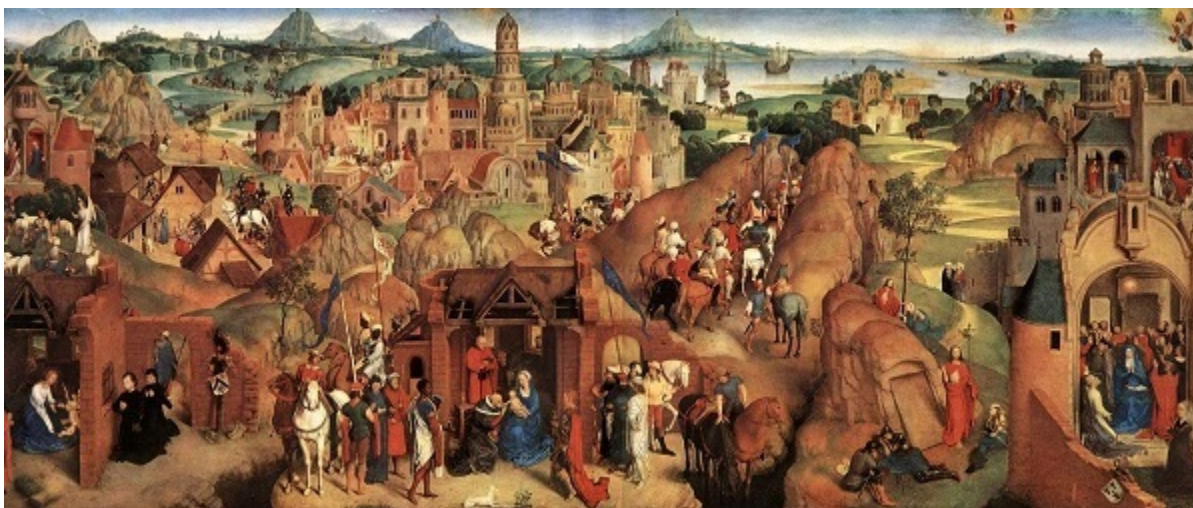
Животът на Богородица 1480 г. Дърво, 81 x 189 см. Мюнхен, Старата пинакотейка.

Мъртвият Христос и оплакващата сина си Богородица — тема на няколко изображения от нашето табло — е рядък мотив в творчеството на рисуващия ведри, тържествени мадони художник. Очевидно не тук е неговата сила: женските сълзи, капките кръв по тялото на Христос, странният израз на полуотворените му очи не трогват (нещо, което би се удало на не един негов съвременник), колкото и натуралистична да изглежда картината. Вместо да се задълбочим в изобразената скръб, ние се възхищаваме от красотата на голото Исусово тяло, от разнообразния персонаж. Фигурата вдясно по всяка вероятност е таен портрет на човека, който е поръчал картината.