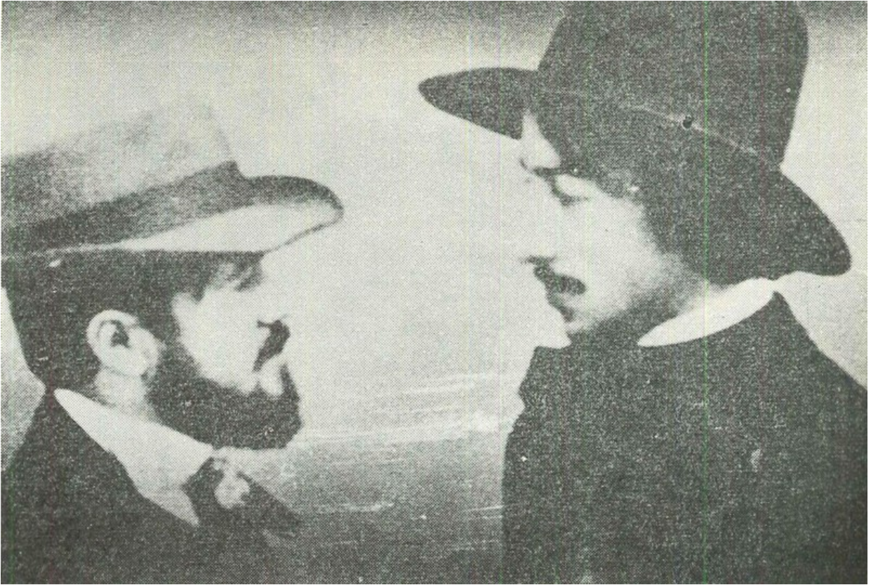
Димчо Дебелянов и художника Георги Машев