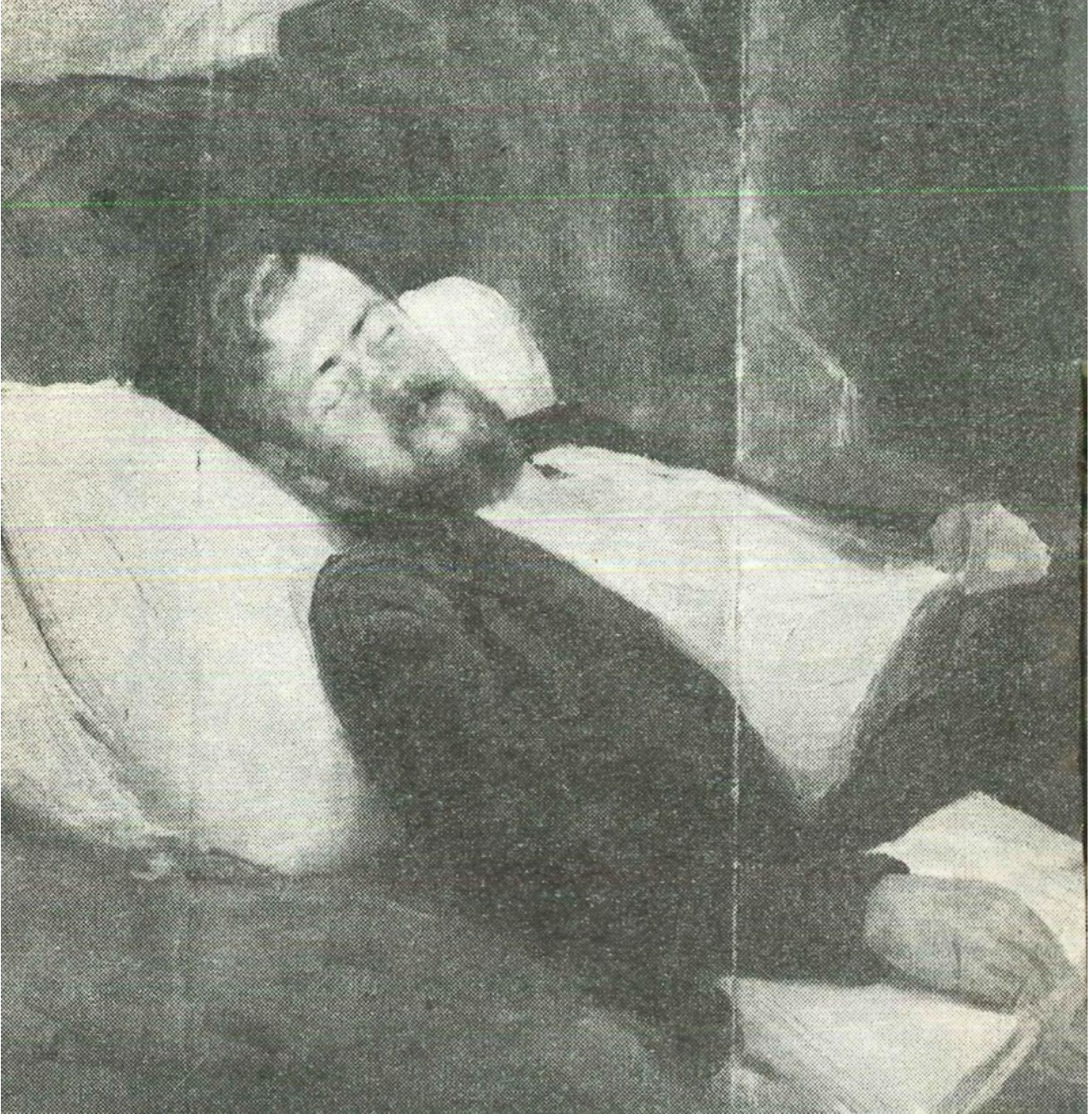
Портрет на Димчо Дебелянов от художника Георги Машев