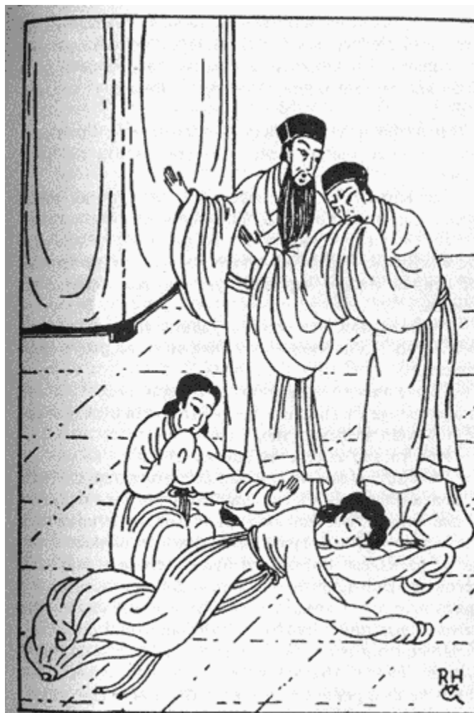
СЪДИЯТА ДИ И СЪВЕТНИКЪТ БАН ПРАВЯТ ОГЛЕД

Той изтри потта, избила по челото му. Господин Бан гледаше съчувствено към проснатата на пода жена.