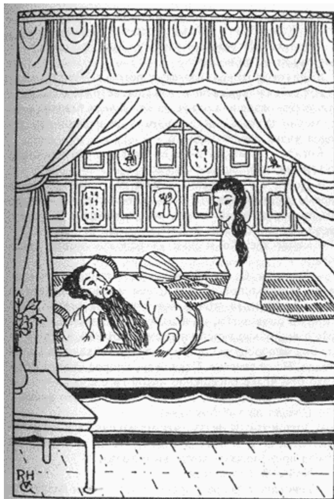
СЪДИЯТА ДИ И РОЗОВ КАРАМФИЛ

— Имаш право — каза съдията със спокоен глас. — Аз наистина играя роля. Но не за да се смея за твоя сметка. Аз съм императорски чиновник и разследвам едно убийство. Както се и надявах, вие с Ефрейтора неволно ми помагате в моята работа и затова именно започнах комедията. Вярно е, че не съм от твоята черга, но пък трябва да знаеш, че съм дал клетва да служа на държавата и на китайския народ, а това значи и на теб, както и на първата съпруга на префекта, на Ефрейтора, както и на първият министър. Целият китайски народ е едно огромно семейство, Розов Карамфил. В това се корени вековечната ни слава, това е разликата между просветените поданици на империята в центъра и варварите, които населяват останалата част