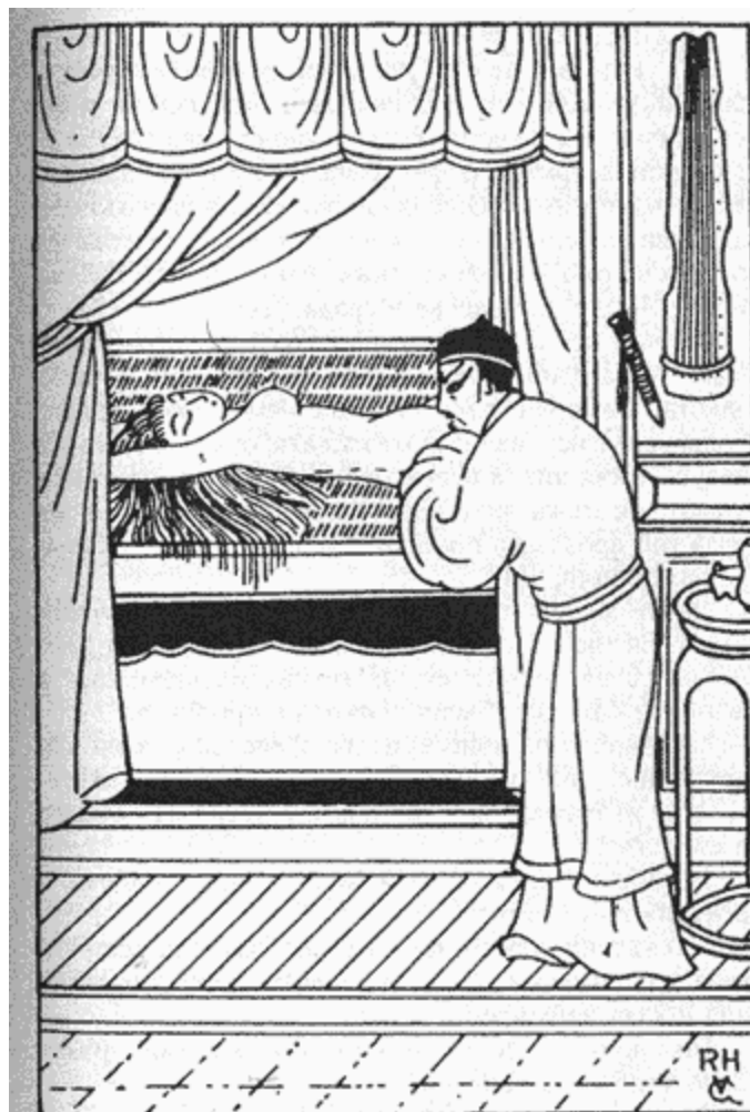
МАГИСТРАТЪТ ДЪН СЪЗИРА ЖЕНА СИ

Дън зарови лице в дланите си и изхлипа сподавено, подпрян о рамката на вратата.